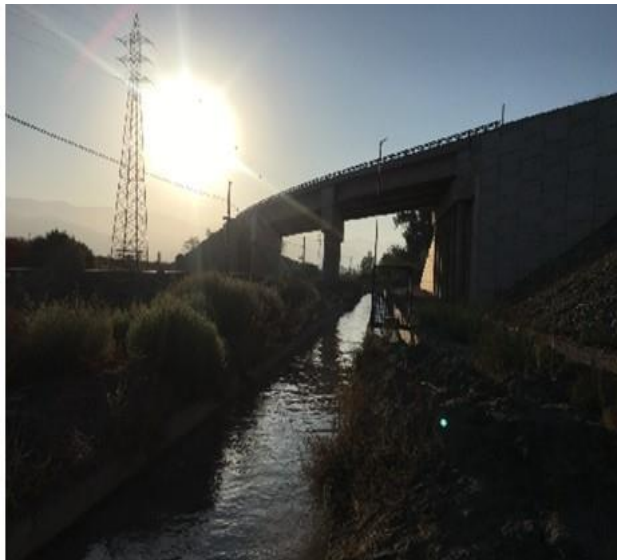
Foto 1. Canal La Pirca.