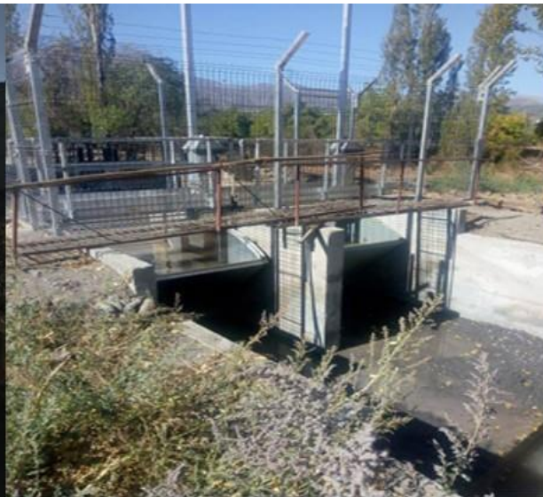
Foto 2. Canal San Miguel.