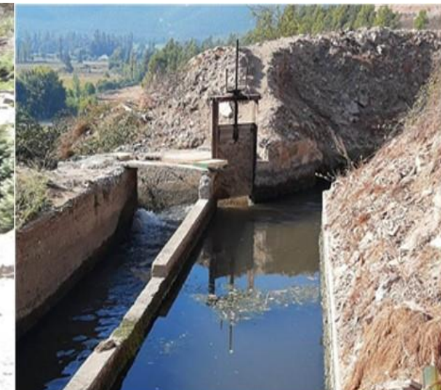
Foto 4. Descarga Canal Lorino.