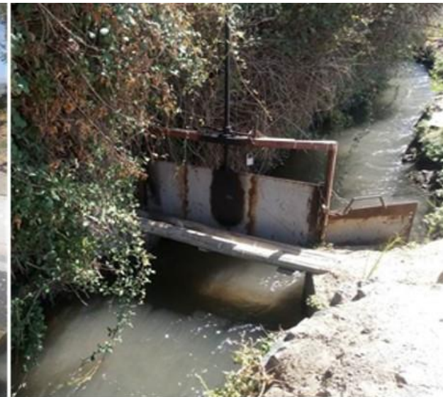
Foto 3. Canal Purehue.